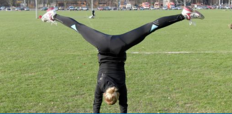
Tagung der dvs-Sektion Sportmotorik 2011 „Embodiment: Wahrnehmung – Kognition – Handlung“